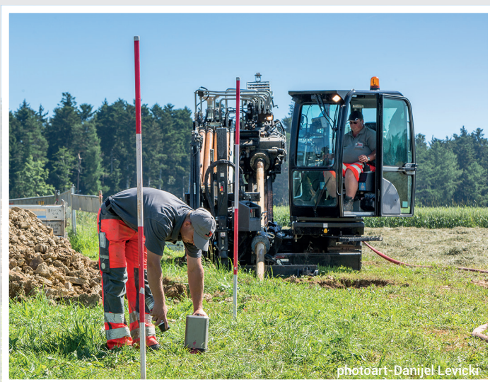
photoart - Danijel Levicki